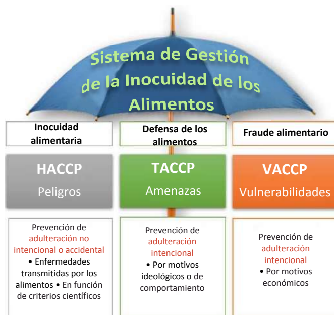
Figura 2. Diferencias entre HACCP, TACCP y VACCP