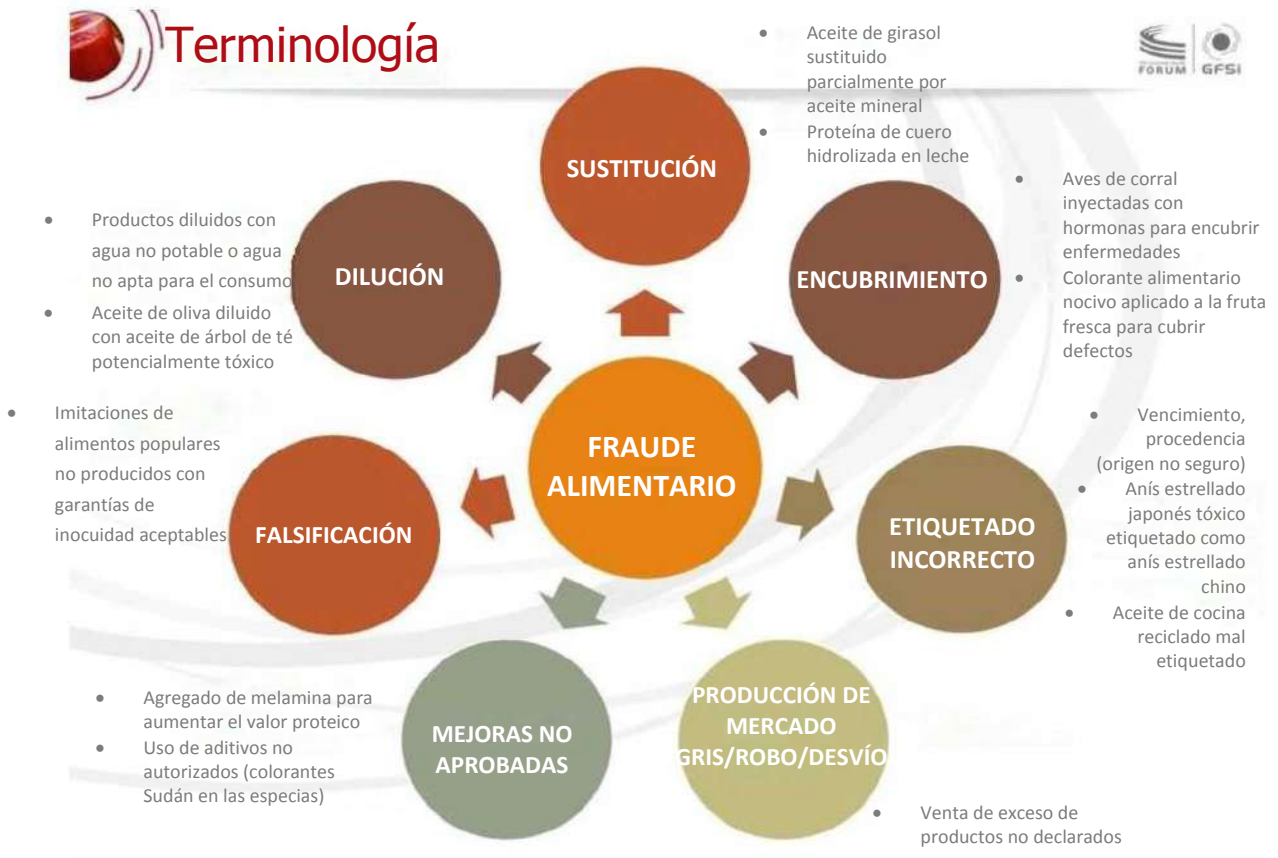
Figura 3. Tipos de fraude alimentario de la GFSI 8