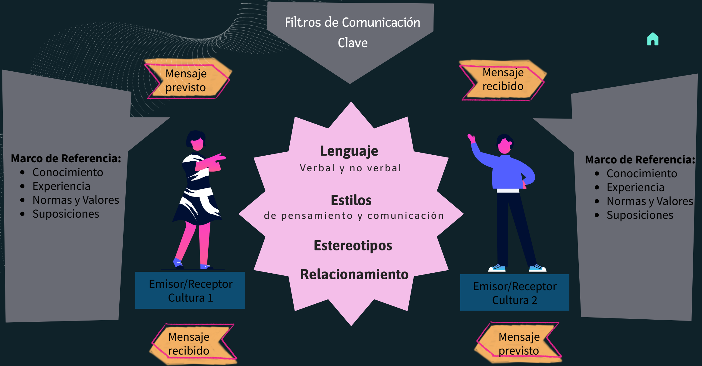
Model of cross-cultural communication.