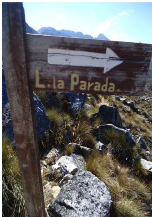
Figura 8. Sendero Cusiri