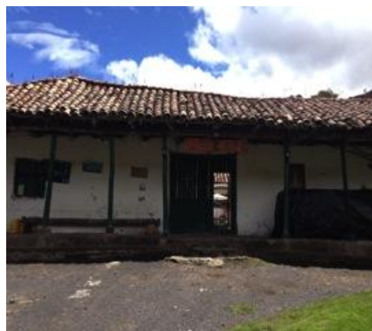
Figura 4 Guía Turístico PNN El Cocuy. Gabriel Serrano