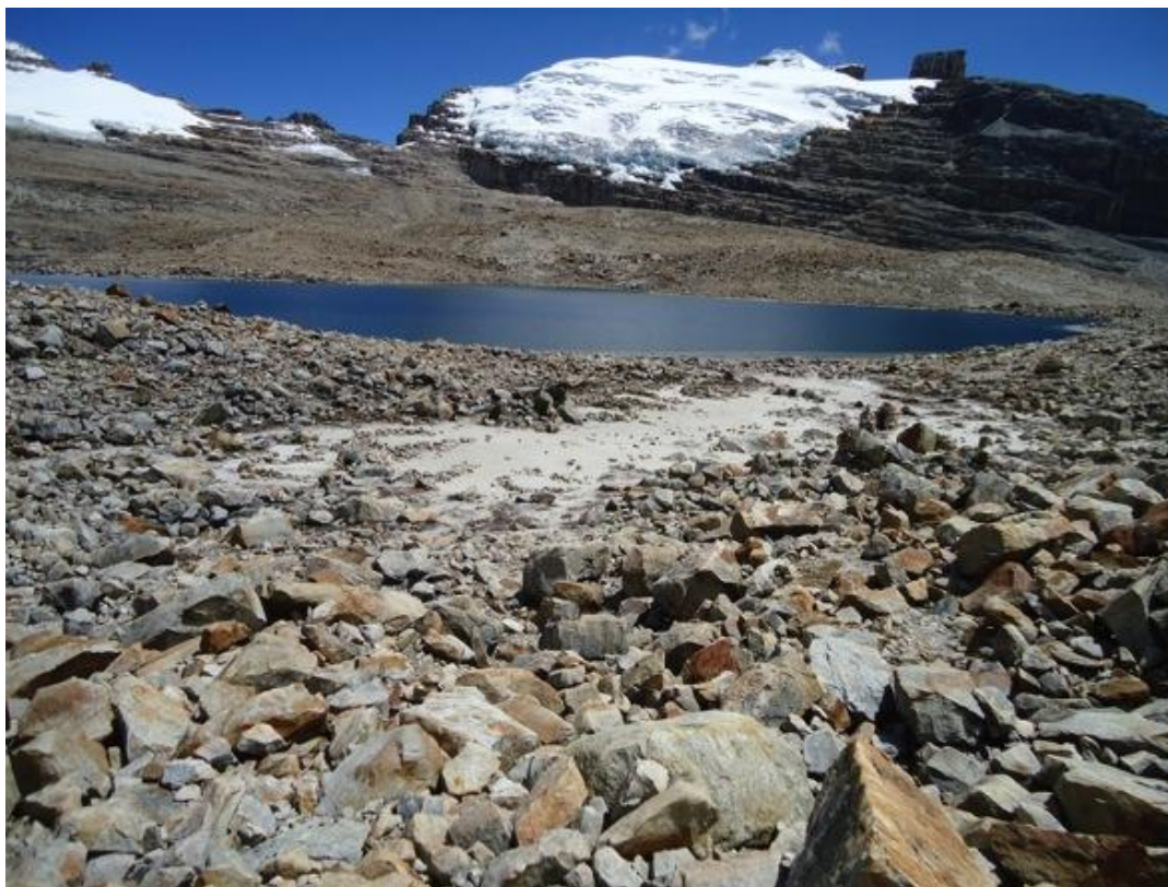
Figura 11. Sendero Conexión

Siguiendo entre la morrena, compuesta por rocas que en décadas anteriores fueron cubiertas por el glaciar y que actualmente se encuentran en proceso de meteorización poco a poco permiten la colonización por frailejones y otras plantas en estas alturas. Aquí se ubica la denominada Playa de los flojos, metros mas adelante se encuentra la zona de camping conocida como Playa Media, que cuenta con capacidad para 36 personas en 12 carpas. Siguiendo la señalización se puede llegar a la tercera zona de camping denominada Playa Blanca, que cuenta con capacidad para 30 personas en 10 carpas. Retomando el sendero principal se llega a un mirador y una valla informativa de donde se tiene una vista de 360 grados de la Laguna Grande de La Sierra, espejo de agua que es circundado por los picos nevados de El Cóncavo, El Portales, El Toti, el peligroso paso de Bellavista, el Pan de Azúcar y la roca de El Pulpito del Diablo. Desde allí