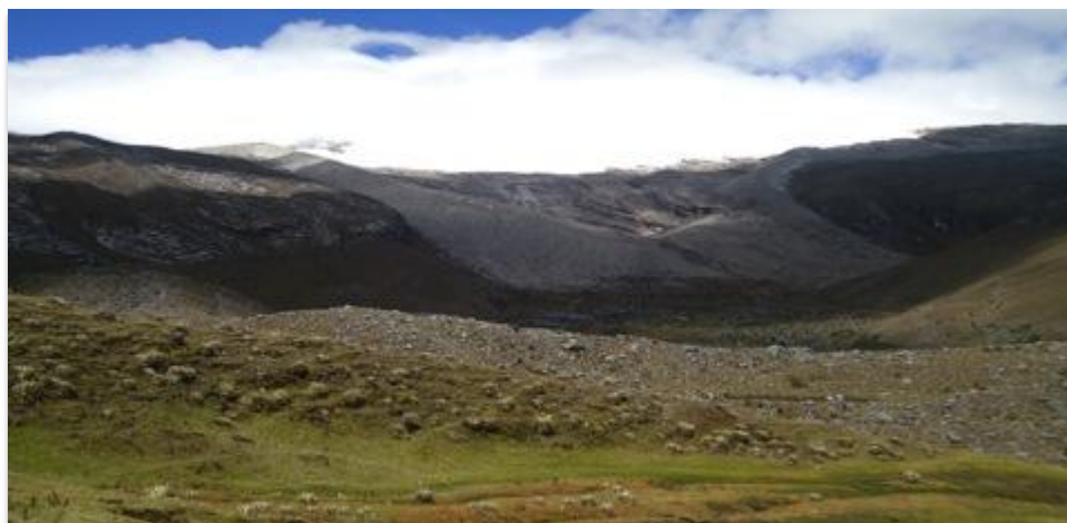
Figura 6. Sendero Boquerón del Cardenillo

y regreso aproximadamente. Debido a estas condiciones, el perfil del visitante se diferencia de otras áreas protegidas y de otros destinos ecoturísticos del orden nacional. Principalmente este sendero es para caminantes de alta montaña.