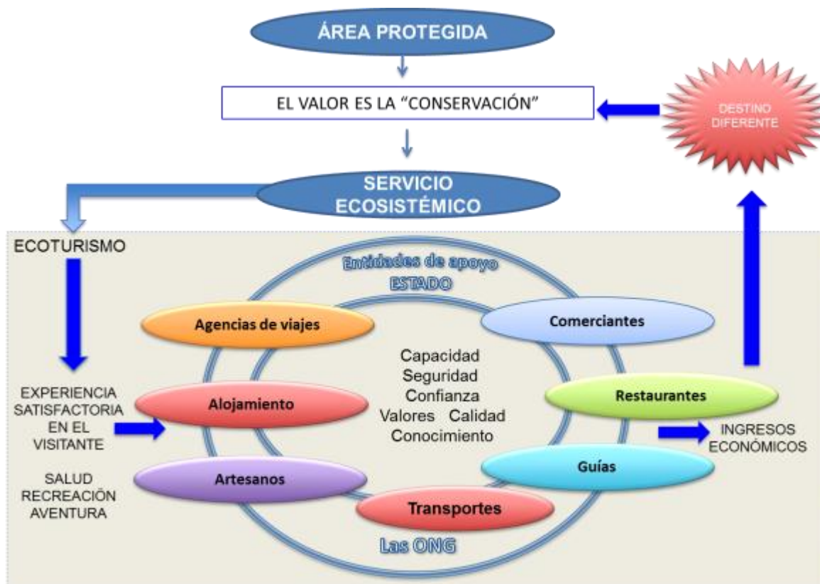
Figura 1 Esquema cadena de valor del turismo relacionada con áreas protegidas. Elaboración propia

El segundo aspecto, es el “valor” logrado a través de esas alianzas solidarias que se establecen entre prestadores de servicios como por ejemplo, la capacidad para vender el producto especializado como el “ecoturismo”, cumplir con la promesa de venta (evitar publicidad engañosa), valores de ética y solidaridad comercial (apoyo permanente entre los prestadores), calidad y conocimiento del lugar, entre otros elementos; los cuales son consumidos por el visitante durante su experiencia y que no encuentra en destinos que no están encadenados.