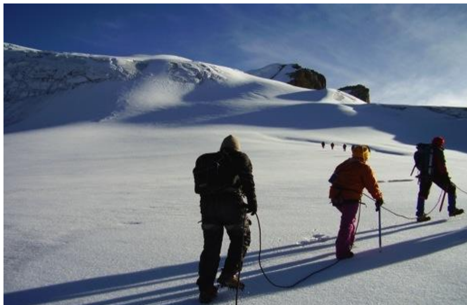
Figura 3 Visitantes PNNEC.

Ingresan al PNNEC aproximadamente 14.000 personas predominantemente nacionales, donde las personas con edad entre 26 y 35 años son los dominantes, seguidos por las personas de 16 a 25 años y de 36 a 50 años, siendo minoría los mayores de 50 años. La mayoría de los visitantes tiene un nivel de escolaridad profesional, que viajan principalmente en grupos de amigos y de familiares y menor proporción en excursiones y parejas. El medio por el cual se informan en su mayoría corresponde a familiares y amigos, seguido por el internet, folletos y prensa, grupos universitarios y en menor proporción por Tv y radio.