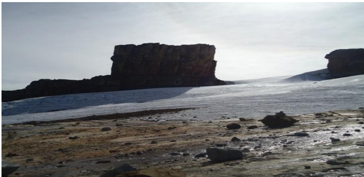
Figura 9. Sendero Lagunillas

Durante el paso por el valle Río Lagunillas el paisaje se va transformando en un páramo con presencia de relictos arbustivos de medio porte a vegetación baja como uvo de páramo, paja y pequeños frailejones articulado con conglomerados de musgos, líquenes, hypericum , suelo de rocas metamórficas y arenas, a la vez que, se vislumbra el zigzag de las aguas que corren en el río Lagunillas.