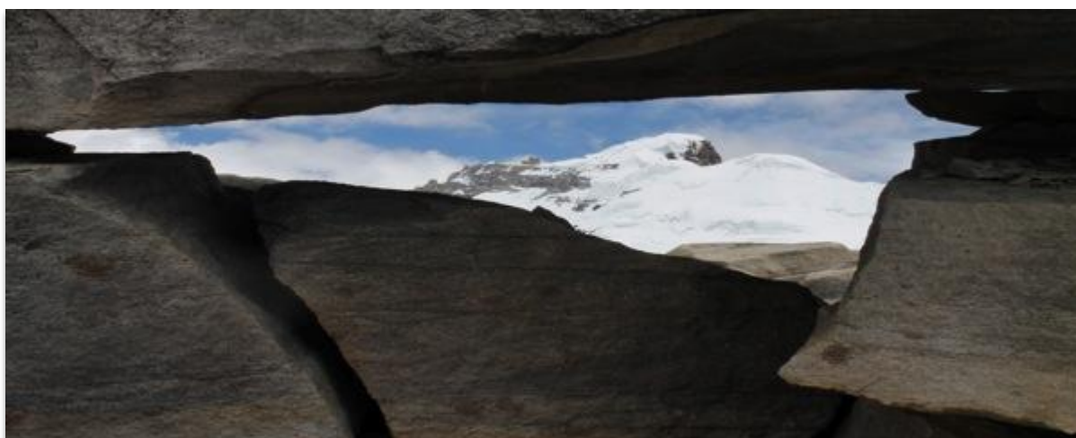
Figura 7. Sendero Ritacubas

Recorrido que se puede efectuar desde Municipio de El Cocuy o Güicán (resultando más cerca de este último), siendo el punto de partida la hacienda Ritacuba donde se encuentra el desvío para iniciar el recorrido.