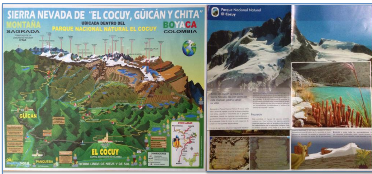
Figura 13 Folletería de promoción turística impulsada por el PNNEC.

De otra parte algunos PST tienen sus tarjetas personales que entregan a los visitantes después de su visita para que socialicen con su experiencia y así se contacten visitantes potenciales. Otros esfuerzos que están naciendo es el de diseñar páginas web mediante las cuales se enganchen visitantes y lógicamente las alianzas entre PST son también un medio muy común en los dos municipios.