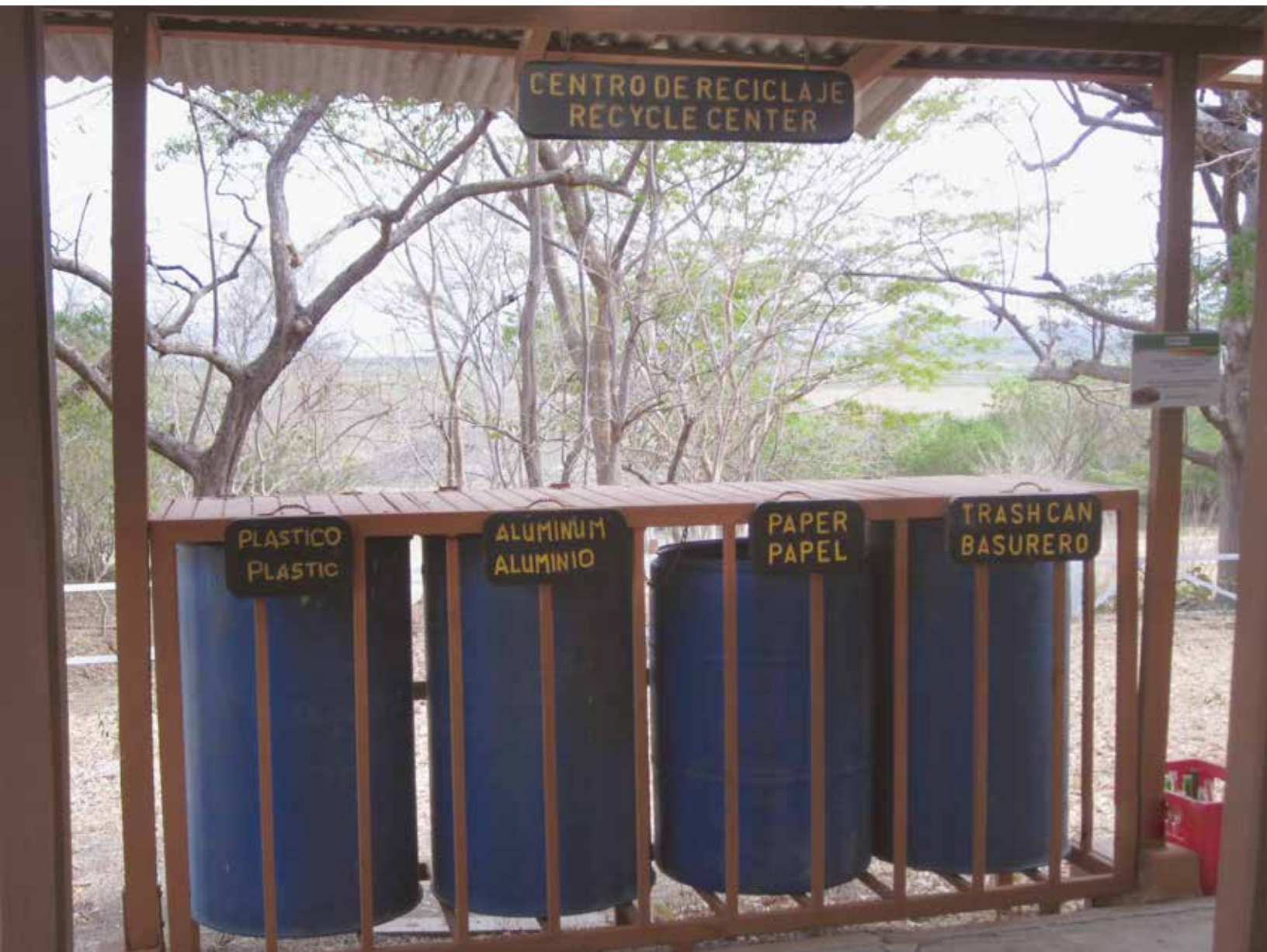
Recipientes para separación de materiales valorizables.

Por ejemplo, a continuación se muestra una fotografía que ilustra el manejo de residuos sólidos en el Parque Nacional Palo Verde.