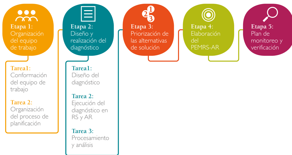
Figura 1. Etapas para la elaboración del PEGIRS-AR en ASP

A continuación se detalla cada una de las etapas anteriormente mencionadas.