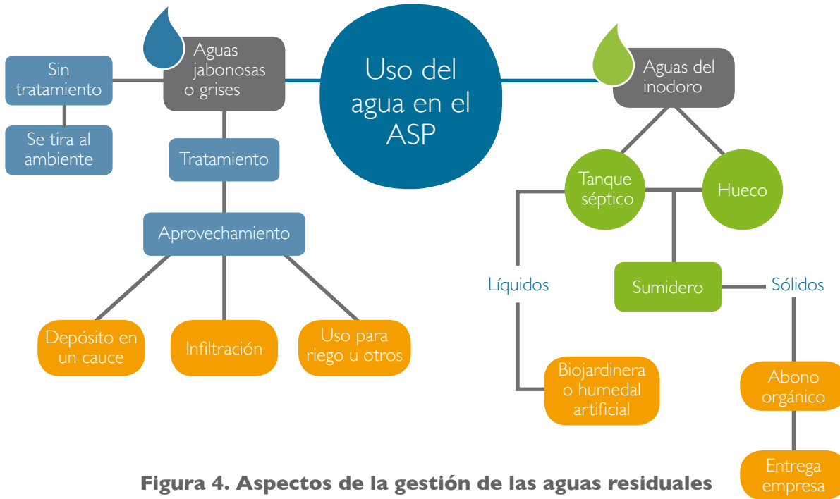
Figura 4. Aspectos de la gestión de las aguas residuales