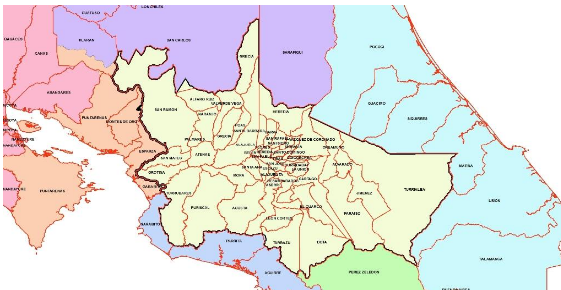
Mapa 1. Unidades de Planeamiento Turístico y Cantones respectivos.

UPT Valle Central y cantones que la integran.