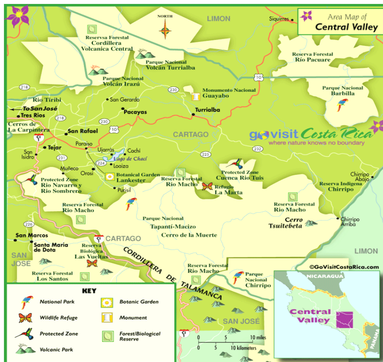
Mapa 2. Complejo de Áreas Silvestres Protegidas en inmediaciones de la Cordillera de Talamanca.

Fuente: Área Map of Central Valley. Go visit Costa Rica, 2010