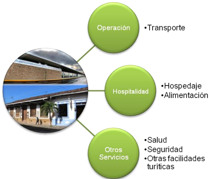
Fig. 5. Sistemas de apoyo del casco antiguo de Liberia y su entorno inmediato.

Entorno a la actividad turística que se genera en Liberia, es que se ha establecido también una serie de servicios que igualmente son requeridos por los turistas, tal es el caso de restaurantes, tiendas de recuerdos, supermercados, gasolineras, farmacias, tour operadores, guías, entre otros.