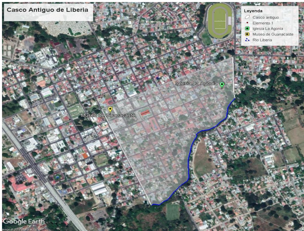
Fig. 2. Delimitación área de estudio.

mapa), ubicada al final de la Avenida 25 de Julio, más todo lo que se engloba hacia el sur de los puntos mencionados incluyendo el segmento del río Liberia, marcado en azul en el mapa. (Fig.2).