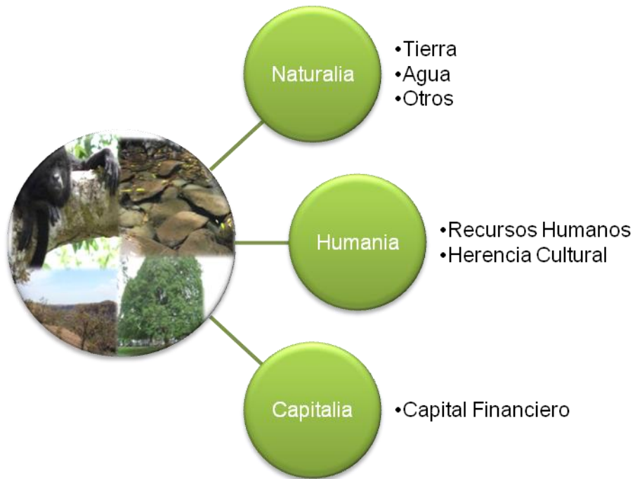
Fig. 3. Factores turísticos del casco antiguo de la Ciudad de Liberia