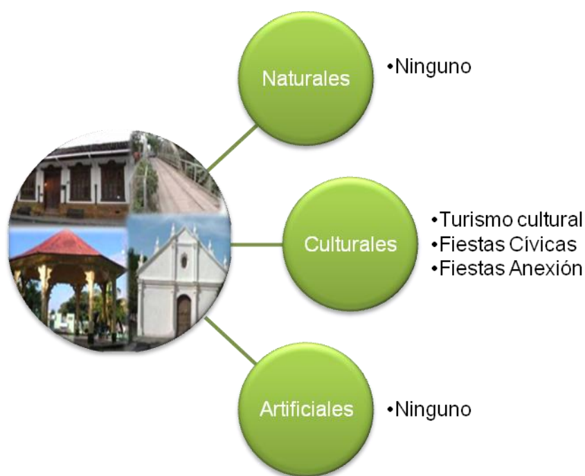
Fig. 4. Atractores turísticos del casco antiguo de la Ciudad de Liberia

Se entiende por atractores turísticos “aquellos elementos naturales, culturales o realizados por la mano del hombre que, combinados con los recursos turísticos, son capaces de motivar un desplazamiento a un determinado destino turístico” (Gallego y Pedro, 2004). La siguiente figura ilustra la clasificación de los atractores turísticos de la ciudad de Liberia.