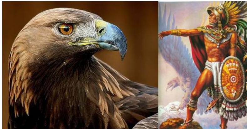
Imagen 5. Águila real y representación de guerrero águila azteca

Tal fue la importancia de éstos dos animales en las culturas mesoamericanas, que en algunas de ellas, los grupos militares eran condecorados con los nombres de estos animales.