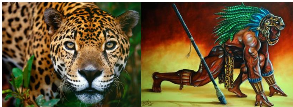
Imagen 6. Jaguar y representación de guerrero jaguar azteca