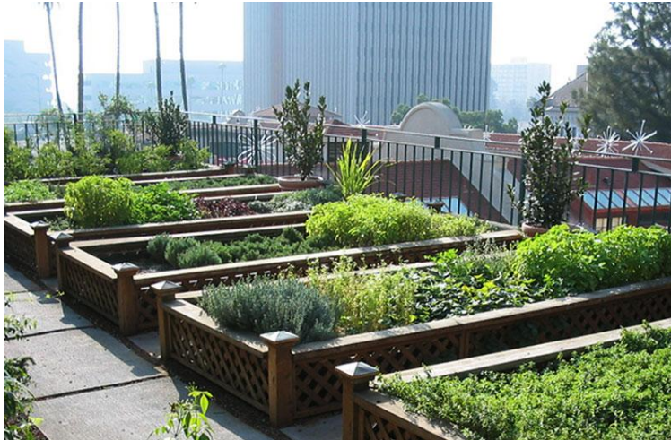
Imagen 9. Representación de huerto urbano

Otro método que se implementará como parte de la decoración del establecimiento y que más allá del una simple decoración ornamental, es la creación de una pequeña huerta. Esta huerta tendrá la función principal de proveer algunos alimentos a la cocina del restaurante para su utilización. Principalmente por motivos de espacio, ya que será una huerta urbana de pequeñas dimensiones, resultaría imposible cultivar en ella todo tipo de vegetales utilizados en la cocina, por lo que en esta se cultivarán hierbas como cilantro, perejil, menta, jamaica, romero, laurel, tomillo, hierbabuena, entre otros, es decir hierbas importantes para la sazón de los platillo preparados en la cocina, y algunas utilizables para la preparación de bebidas.