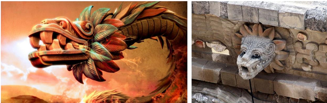
Imagen 4. Representaciones de la Serpiente Emplumada

Además de ser uno de los dioses principales en éstas culturas, los olmecas, teotihuacanos y toltecas también le rendían culto. Así mismo, es uno de los dioses prehispánicos más reconocidos en la actualidad por la población mexicana.