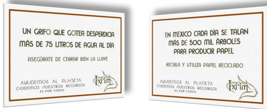
Imagen 2. Muestra de letreros de valores ecológicos integrados al producto

Así mismo, los equipamientos e instalaciones del restaurante, jugarán por su parte un papel importante en la experiencia del comensal. Haciendo uso de equipos y mobiliario e instalaciones de bajo consumo de recursos naturales, los clientes podrán darse cuenta del compromiso que adopta el restaurante en la protección del medio ambiente. De igual manera, se informará a los clientes con cierta regularidad sobre los alcances de las políticas de sostenibilidad ambiental aplicadas en las operaciones del establecimiento, de tal forma de ellos sean testigos del impacto de las buenas prácticas de la sostenibilidad.