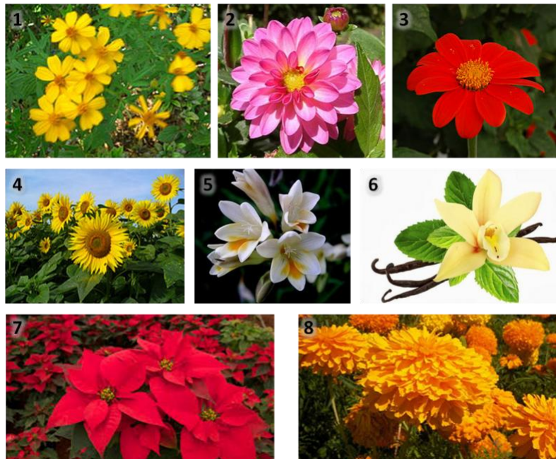
Imagen 8. Imagen de flores de origen mexicano 1. Yauhtli 2. Dalia 3. Girasol mexicano 4. Girasol 5. Nardo 6. Vainilla 7. Noche buena 8. Cempasúchil

De este modo, a fin de cumplir con el compromiso ambiental que ha adoptado el restaurante, y el concepto regional que le da unicidad, la elección de los ornamentos naturales, encajar con el mismo concepto, por lo que elegirán únicamente flora de especies endémicas de México, como lo son: 1) Yauhtli, 2) la Dalia, declarada en 1963 como la flor nacional de México 3) el girasol mexicano, 4) el girasol, 5) el nardo y 6) la vainilla (orquídea); así mismo, se elegirán como decoración ocasional, especies con temporalidades específicas como las noche buenas (épocas invernales) y el cempasúchil (meses de Octubre y Noviembre).