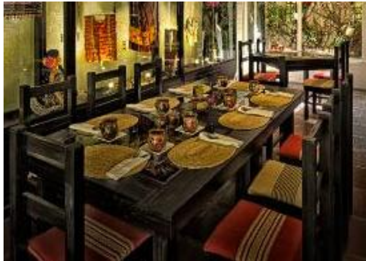
Imagen 11. Modelo de sillas para restaurante Ixi'im

La imagen de abajo, es un ejemplo de la sillería a utilizar, la cual al igual que la mesa, está ensamblada con partes de madera que le da la decoración una esencia rustica. Así mismo, como adición a la decoración el restaurante, éstas estarán tapizadas con tejidos de alta calidad y elegancia con diseños que evoquen a la época prehispánica, sin demeritar la comodidad de la misma.