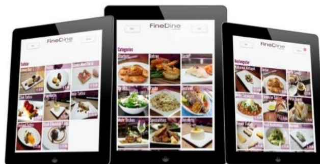
Imagen 13. Muestra de aplicación de menú digital interactivo

Entendiendo que el restaurante no sólo recibirá la visita de clientes cercanos a la tecnología actual, éste será un servicio plus que se ofrecerá a los comensales, siendo ellos quienes decidan si desean utilizarlo, o utilizar el servicio tradicional personal.