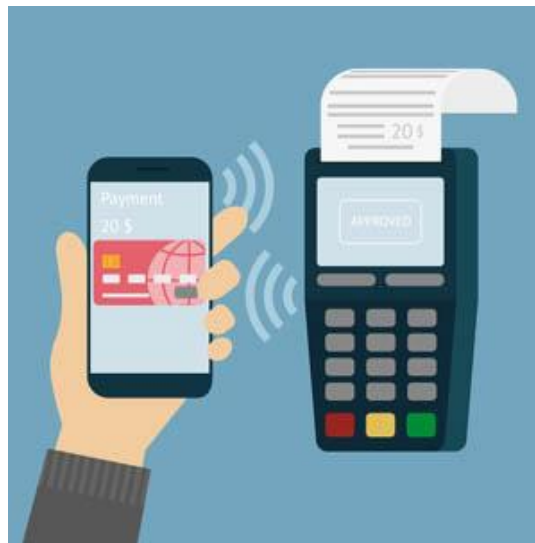
Imagen 14. Representación de pago móvil

Como forma de protección y seguridad a los clientes del restaurante Ixi'im, se implementarán diversos sistemas de pago con los que ellos se sientan seguro, ya sea a través de los métodos convencionales, pago en efectivo o terminal bancaria móvil, o implementando un sistema de pago a través de una aplicación móvil que por medio del celular, tableta electrónica persona, o la tableta electrónica del restaurante, el comensal pueda hacer el pago correspondiente de su cuenta.