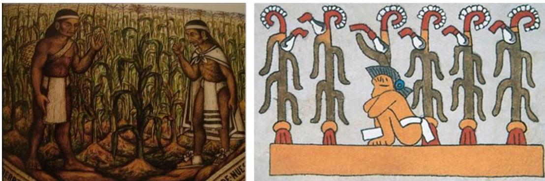
Imagen 7. Representación del maíz en la cultura prehispánica

Así mismo, tiene una connotación espiritual importante principalmente para los antiguos mexicanos, ya que de acuerdo a la leyenda maya, los humanos fueron moldeados por los dioses a partir de los granos de éste alimento.