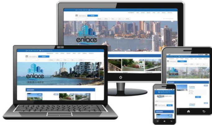
Imagen 12. Muestra de aplicación de página web