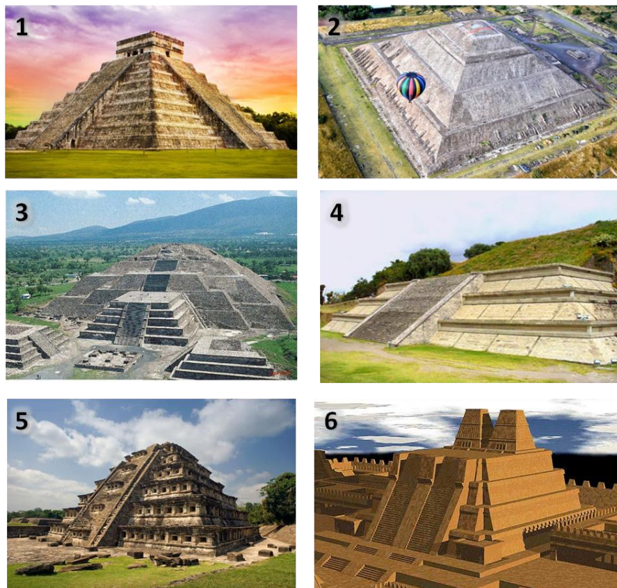
Imagen 3. Pirámides más importantes de México

Sin duda la representación visual de estas pirámides, sería el principal elemento a destacar en la decoración del restaurante, ya estas edificaciones son la forma de arquitectura más conocida de la época prehispánica y la cual transportaría a los comensales más fácilmente a dicho espacio temporal.