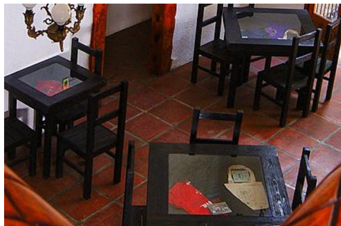
Imagen 10. Modelo de mesas para restaurante Ixi'im

El modelo de mesa seleccionado, es una mesa cuadrada de madera que le da un toque rustico que se acomoda con el resto de la decoración del establecimiento, y cuenta con una superficie de cristal y un doble fondo para sirve como una especie de aparador, qué, apoya a llevar a cabo la misión del restaurante Ixi'im del crear un vínculo de identificación cultural entre los comensales y las tradiciones e ideologías de las antiguas civilizaciones mesoamericanas; al tener la posibilidad de colocar elementos culturales de las civilizaciones mesoamericanas dentro de estos, y mostrar a los comensales parte de la importancia de estos en el sociedades antiguas.