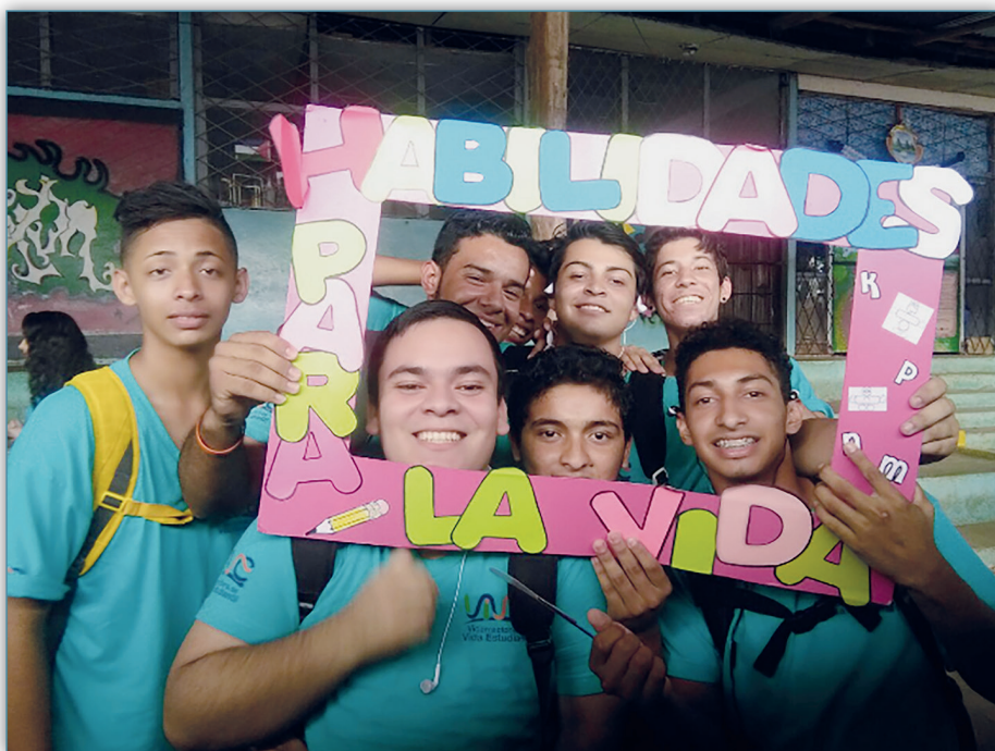
Figura 9. Proyecto habilidades por la vida

integradas con el proceso de orientación para la vida, con la población de décimo y undécimo año. Este proyecto se ha desarrollado con estudiantes de colegios que se ubican en las zonas de Sarapiquí y Nicoya.