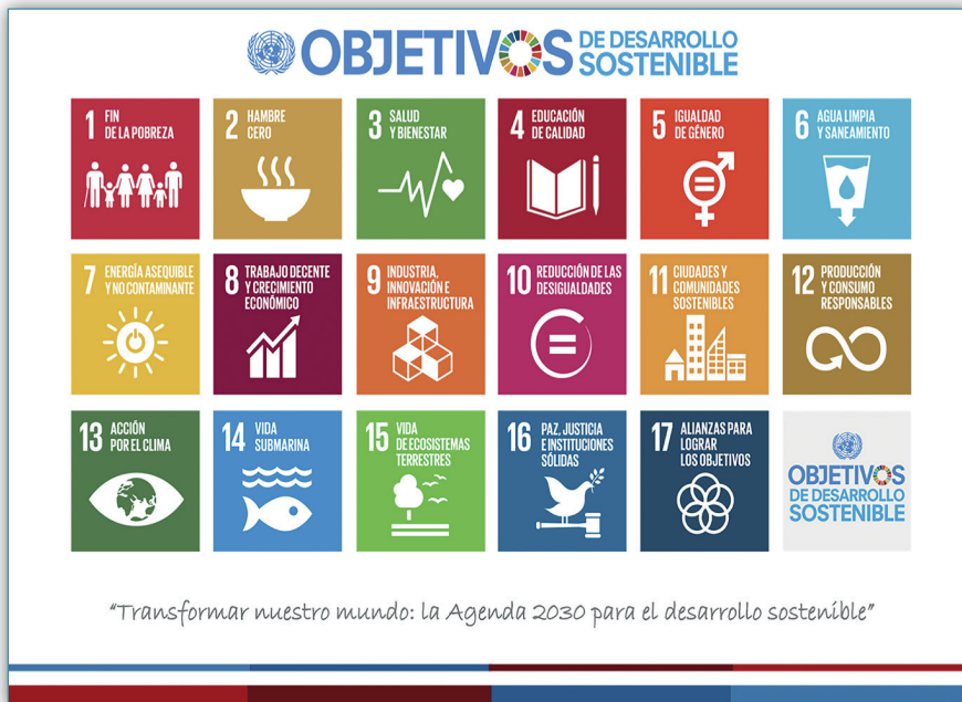
Figura 3. Objetivos de Desarrollo Sostenible para la Agenda de Desarrollo 2030

Costa Rica fue uno de los 193 países firmantes de la Declaración de los Objetivos de Desarrollo Sostenible de la Agenda 2030. El compromiso de los firmantes de esta declaración es realizar un conjunto de programas, acciones y directrices que orienten el trabajo en conjunto con las Naciones Unidas camino al desarrollo sostenible.