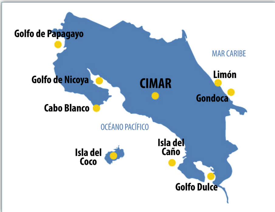
Figura 17. Sitios de investigación del CIMAR