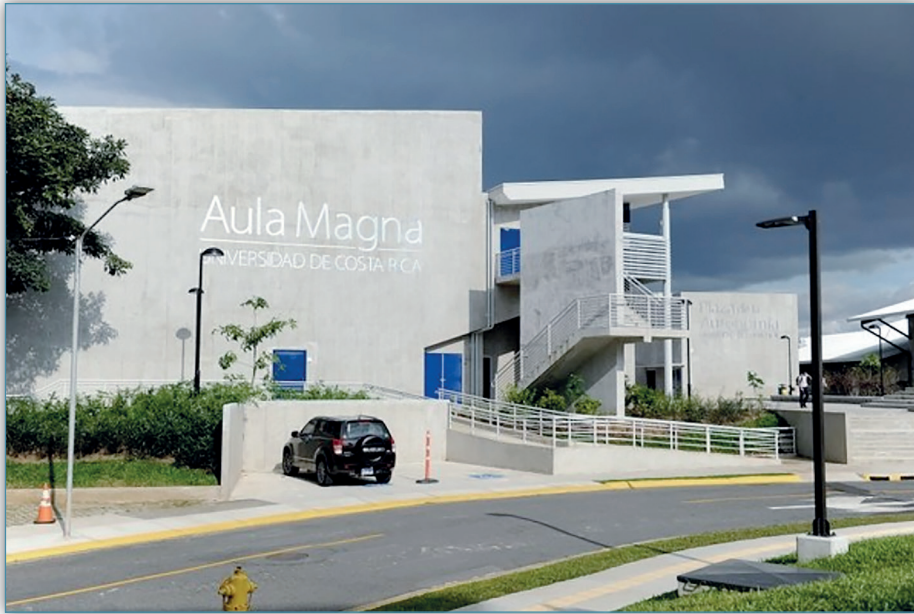
Figura 1. Oficina de Divulgación, 2018, Plaza de la Autonomía