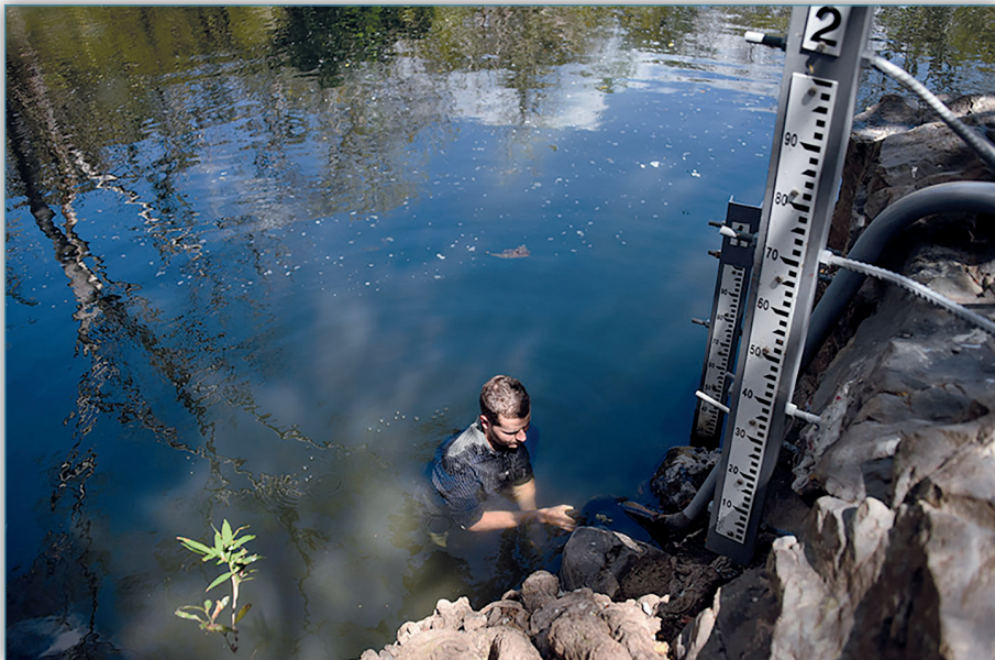
Figura 12. Todos los meses, un equipo de profesionales de la UCR realiza mediciones y el análisis del agua en el río Abangares y sus afluentes. Para ello, se apoyan con estaciones de medición de caudal y de medición de lluvias, así como con estaciones meteorológicas instaladas a lo largo de la cuenca