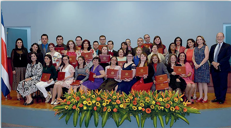
Figura 10. Graduación PROCALA

En el año 2015 inició el Proyecto de Cursos Libres de Capacitación Laboral (PROCALA), que consiste en una oferta de cursos para capacitación laboral dirigido a estudiantes de PROIN, en colaboración con el Consejo de la Política de la Persona Joven del Ministerio de Cultura y Juventud (MCJ). Este Programa ya graduó los primeros 31 estudiantes en el año 2017. Los estudiantes recibieron un certificado de aprovechamiento (avalado por Servicio Civil), lo cual les permitirá un mejor ingreso al mercado laboral con base en su preparación Universitaria.