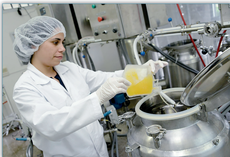
Figura 6. Fraccionamiento de plasma. Instituto Clodomiro Picado