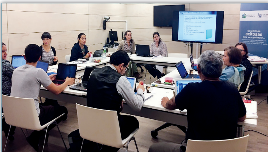
Figura 13. Programa Modular en evaluación