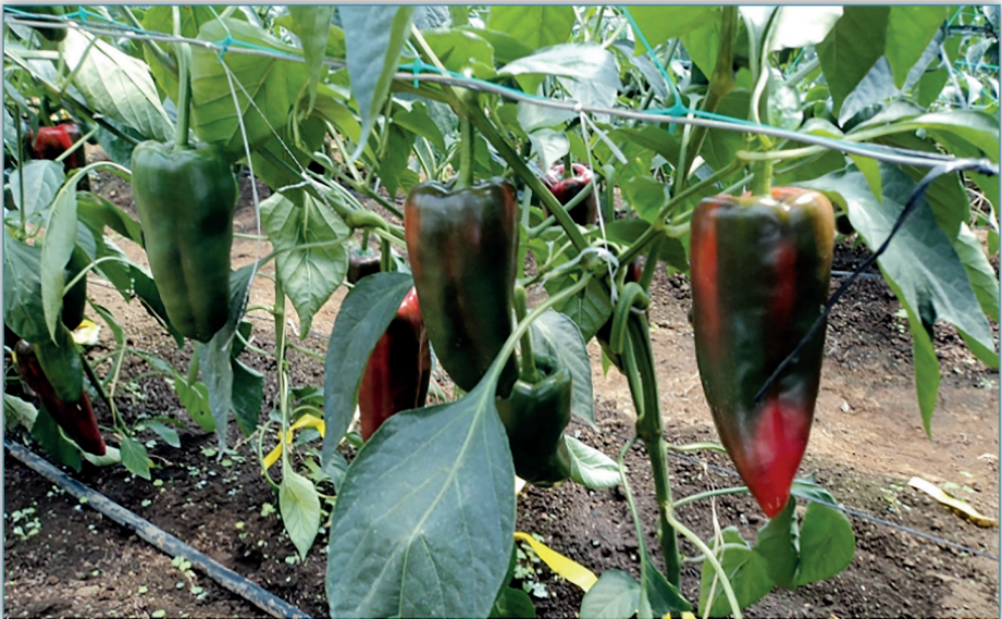
Figura 5. La variedad de chile dulce “Dulcítico” al ser mejorada en condiciones de Costa Rica, está mejor adaptada a las condiciones agroclimáticas por lo que es más productiva