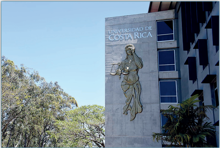
Figura 2. Facultad de Derecho, 2018