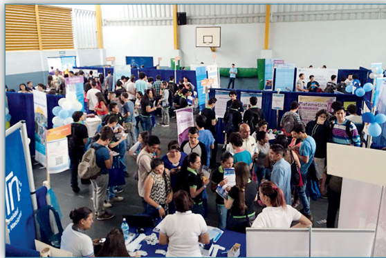
Figura 8. Feria vocacional

Para que el estudiante de secundaria se oriente en la escogencia de la carrera universitaria, la UCR ha realizado la Feria Vocacional durante más de 20 años con una participación cercana a 20 000 jóvenes por año, que visitan la institución para conocer las diferentes ofertas de carreras.