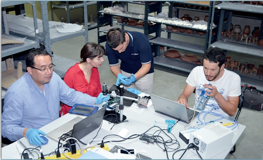
Figura 15. Expertos de la Universidad de Costa Rica (UCR) formaron una red junto con otras instituciones nacionales e internacionales con el objetivo de restaurar y conservar el patrimonio nacional costarricense