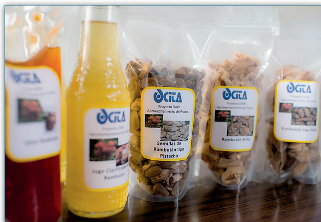
Figura 14. Proyecto de aprovechamiento de frutas