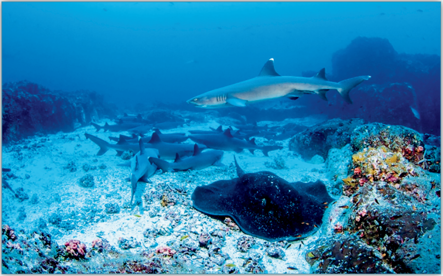
Figura 18. Estudios del CIMAR