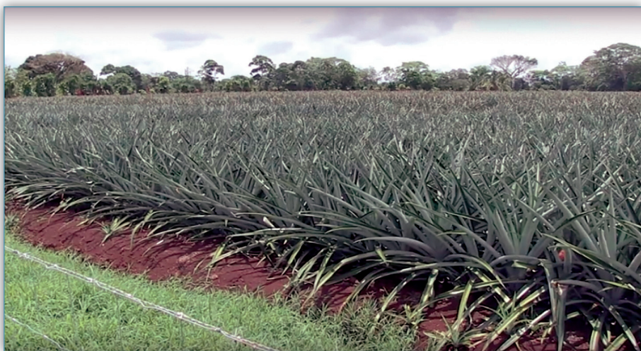
Figura 16. Los investigadores (as) de la UCR atribuyen la contaminación de las aguas a algunos de los agroquímicos que se utilizan en la producción de piña en la Zona Norte de Costa Rica