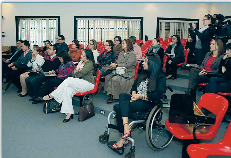
Figura 4. Oficina de Divulgación, 2017. Presentación del modelo de empleabilidad que utiliza la universidad

La Institución reserva tres plazas de tiempo completo para esta población sea académica o administrativa.