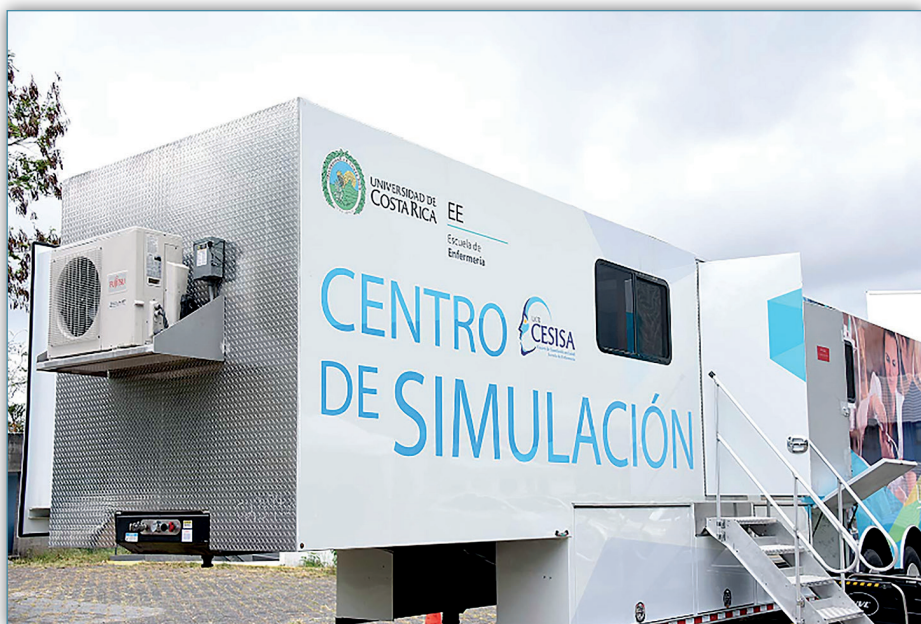
Figura 7. Centro de Simulación clínica móvil. Escuela de Enfermería