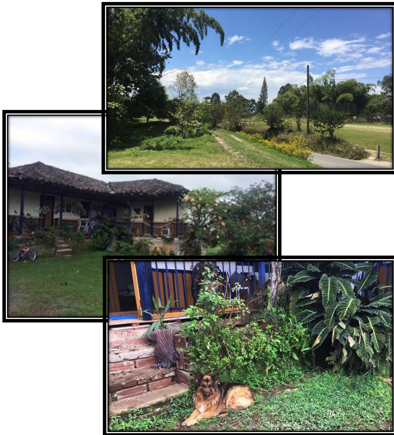
Casa tradicional campesina de la finca Palmichal y su entorno