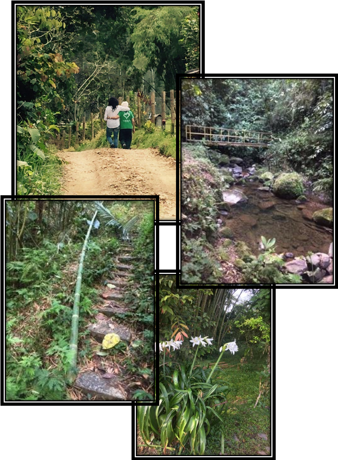
El camino del amor a la naturaleza: senderos, quebrada, jardines, ...