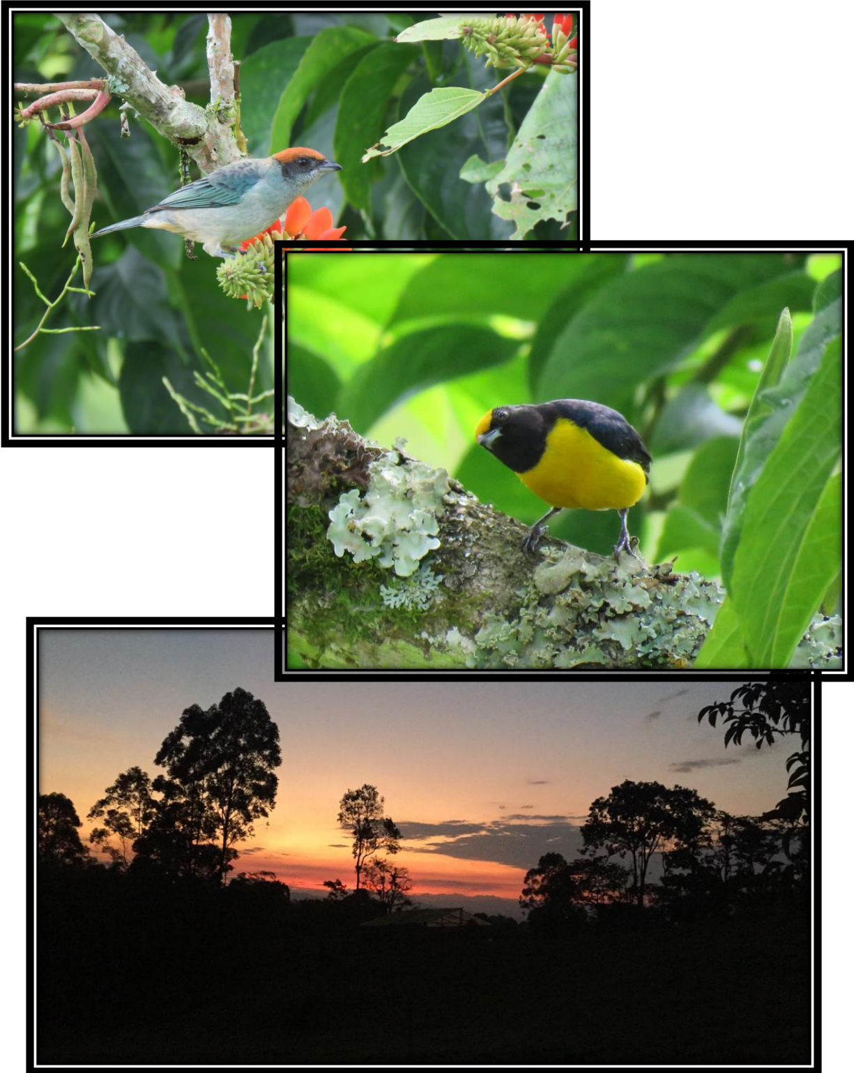
Ecosistema del aérea en protección, gradual, aves.