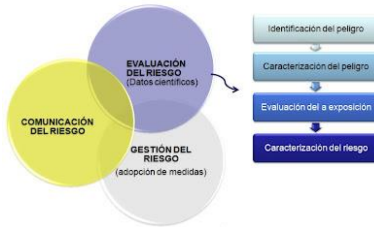
Figura 2. Análisis de Riesgos

La evaluación de riesgos es una caracterización sistemática, soportada en información científica, de los efectos potenciales adversos a la salud humana debido a agentes biológicos, químicos o físicos, y que comprende cuatro etapas sucesivas así: