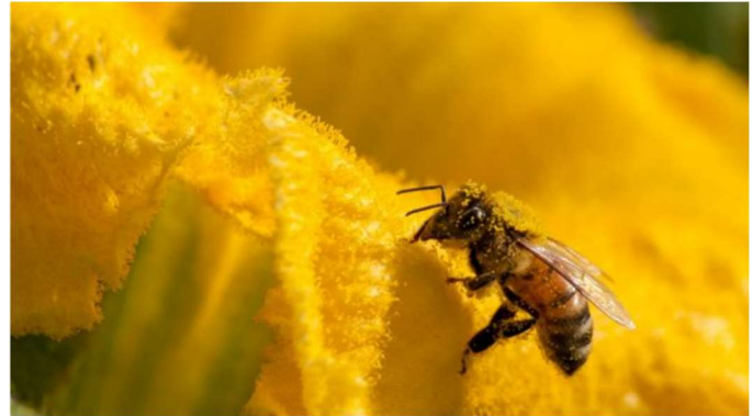
Un millón de especies animales y vegetales están ahora en peligro de extinción.

Es tanto lo que hemos sobrepasado este umbral que algunos investigadores creen que estamos en medio de la sexta extinción masiva en la historia del planeta. Para tener una idea, las extinciones masivas fueron periodos donde se aniquiló del 60 al 95% de las especies.