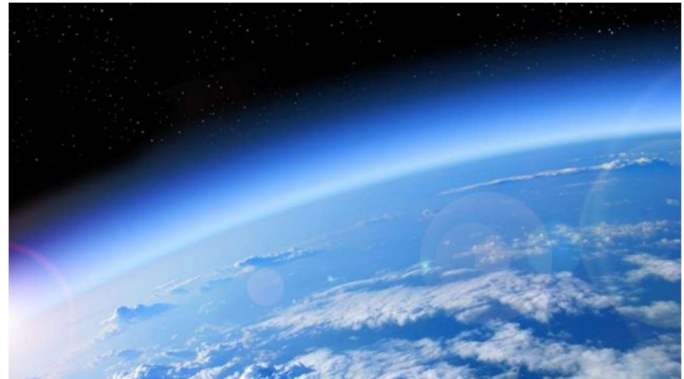
El Protocolo de Montreal vigente desde 1989 prohibió el uso de ciertas sustancias para proteger a la capa de ozono, vital para frenar las radiaciones ultravioletas del Sol..

Tras el famoso Protocolo de Montreal, el ozono estratosférico se ha ido recuperando, lo que hoy nos permite estar tranquilos dentro de la zona segura para este proceso.