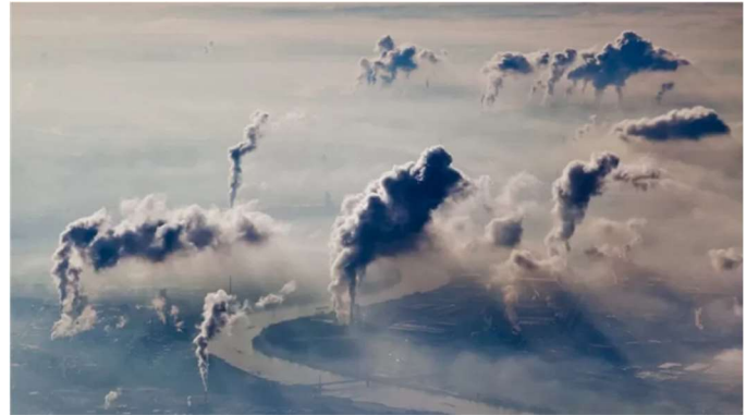
Respirar aire altamente contaminado es responsable de unas 800.000 muertes prematuras cada año..

Estos aerosoles afectan tanto al clima (por ejemplo, provocan cambios en los sistemas de monzones en las regiones tropicales) como a los organismos vivos (unas 800.000 personas mueren cada año de forma prematura por respirar aire altamente contaminado).