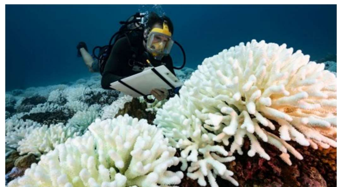
El blanqueo de los corales los expone a enfermedades y ya ha desatado eventos de muertes masivas de estos organismos a lo largo del mundo

Este límite está tan íntimamente ligado con el cambio climático que se le suele llamar su "gemelo malvado".