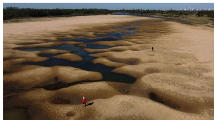
Sequías como la actual del río Paraná que afecta a varios países de Sudamérica son cada vez más frecuentes debido al cambio climático

Según Naciones Unidas (ONU), hoy en día tenemos cinco veces más desastres meteorológicos que en 1970 y son siete veces más costosos. Las consecuencias son más devastación y más muertes.