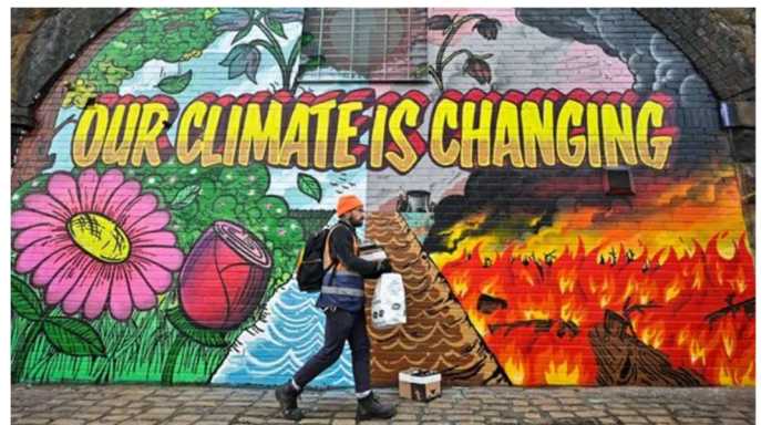
"Nuestro clima está cambiando", dice este mural pintado en Glasgow, sede de la COP26...

Se precisan acciones rápidas y audaces de parte de todos y cada uno de los gobiernos del mundo, empezando por el uso de energías renovables.