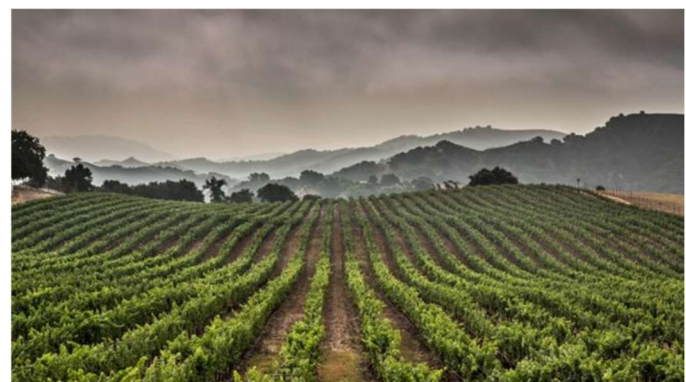
La agricultura representa el 70% del uso de agua dulce en el planeta.

La deforestación, por ejemplo, tiene un enorme impacto en la capacidad del clima para regularse, algo que los especialistas repiten cada vez que hay incendios en el Amazonas. Pero el cambio del uso del suelo es también uno de los impulsores de las graves reducciones de la biodiversidad, sobre todo por la creciente demanda de tierra para producir comida.